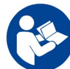
Obbligo di lettura del manuale