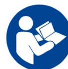
Obbligo di lettura del manuale